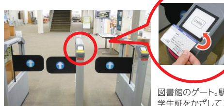
図書館のゲート。駅の改札と同じように、学生証をかざして入ろう。

*「図書館学生サポーター」を募集します。関心のある方は図書館ホームページで詳細をご覧ください。