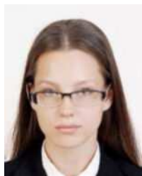
Glasses frame covers eyes