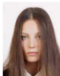
Eyes are obscured by hair