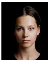
Dark background color makes it difficult to determine outline