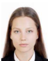
Not clear due to focus issue or vibration of camera