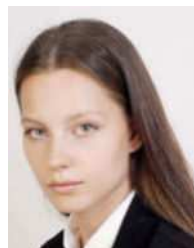
Body is angled