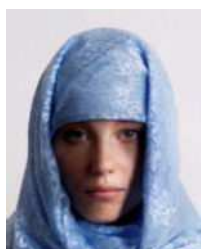
Cloth wrapping creates a shadow on face

(Note) Head wrappings made of cloth, etc. are acceptable if the face is clearly visible.