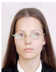
Lighting is reflected in glasses