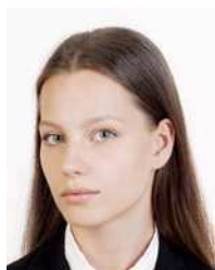
Face is angled to the side