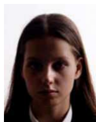
Shadow on face