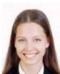
Expression differs greatly from normal expression