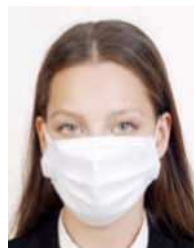
Part of face is covered with a mask