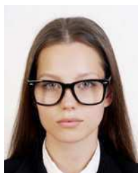
Glasses frame is exceedingly large