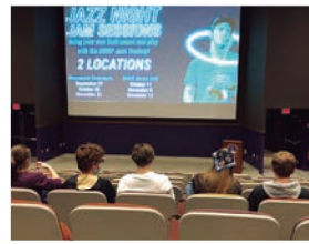
キャンパス内に映画館があり、学生は無料で観ることができます