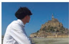
モン・サン・ミッシェル & フランス一人旅