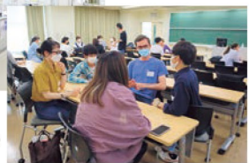
実際に自分が留学に行く言語圏自身の留学生との交流会▶