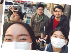
日本人留学生の集合写真