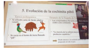
さんの個人プレゼンテーション(オンラインにて)