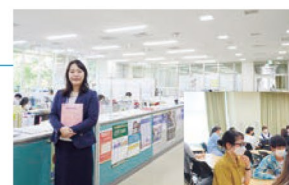
国際交流センター

獨協大学国際交流センターでは、留学がより充実した経験となるよう様々なサポートを提供しています。5月には長期留学予定者を対象に第1回目の事前研修を行いました。留学の目的や目標、将来のビジョンを共有し、留学の意義や効果についての理解を深め、また外国人留学生を囲んで情報交換を行いました。第2回目は7月後半に実施します。留学後には成果を振り返り、その後の学修につなげるための事後研修を予定しています。