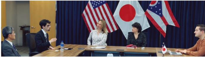
オハイオ州開発省ディレクターへの表敬訪問時のプレゼンテーションの様子

友人や親戚たちとの会話で語学力が大幅に向上しました。日々色々な会話表現を使い続け、自分よりも語学力の高い人と会話することを意識したことで、語学力がアップするのを実感しました。