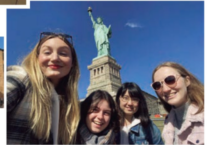
他の留学生やアメリカ人の友達とニューヨークに旅行に行った時の様子