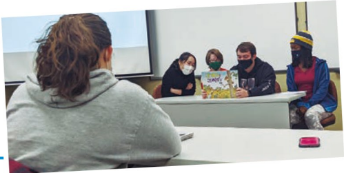
日本語文化アウトリーチの講義における紙芝居の練習風景