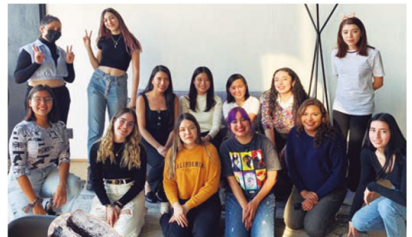
バレンタインの日にグアダハラ大学で日本語を勉強している学生たちと白玉とガトーショコラ作りをしました

仲の良い友人家族とグアダハラ近郊の小さな村に旅行した時のことです。友人とその妹の3人で買い物をしていた際、店員とスペイン語で話をしました。私が立ち去った後に友人の父がその店員と話した時に「あの子(私)だけ兄妹と似てないね」と言われたそうです。「娘だと思われたみたいだよ」と友人に言われ、私のスペイン語がその店員にとってそれほど自然に聞こえたということがとても嬉しく印象に残っています。