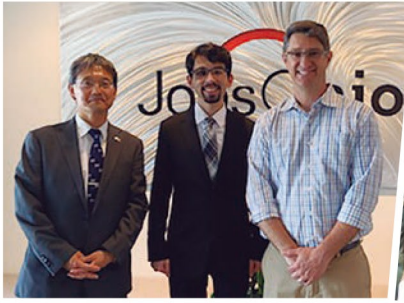
埼玉県オハイオ州スカラシッププログラムの開始に多大な貢献をしたJobsOhioへの表敬訪問