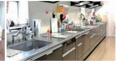
キッチンにはオープンレンジ、トースターが備え付け。毎朝お弁当をつくる館生も。