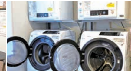
ランドリールームの利用は無料。乾燥機があるので、雨が続けても安心。