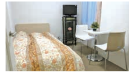
お母さんや姉妹が泊まれるゲストルームは1泊3,000円。