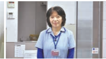
いつも笑顔の寮母さん。「おかえりなさい」の一言がうれしい。