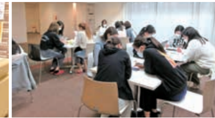
ラウンジで「履修相談会」。履修登録はもちろん、大学生活における様々な不安や疑問を上級生に相談しました。